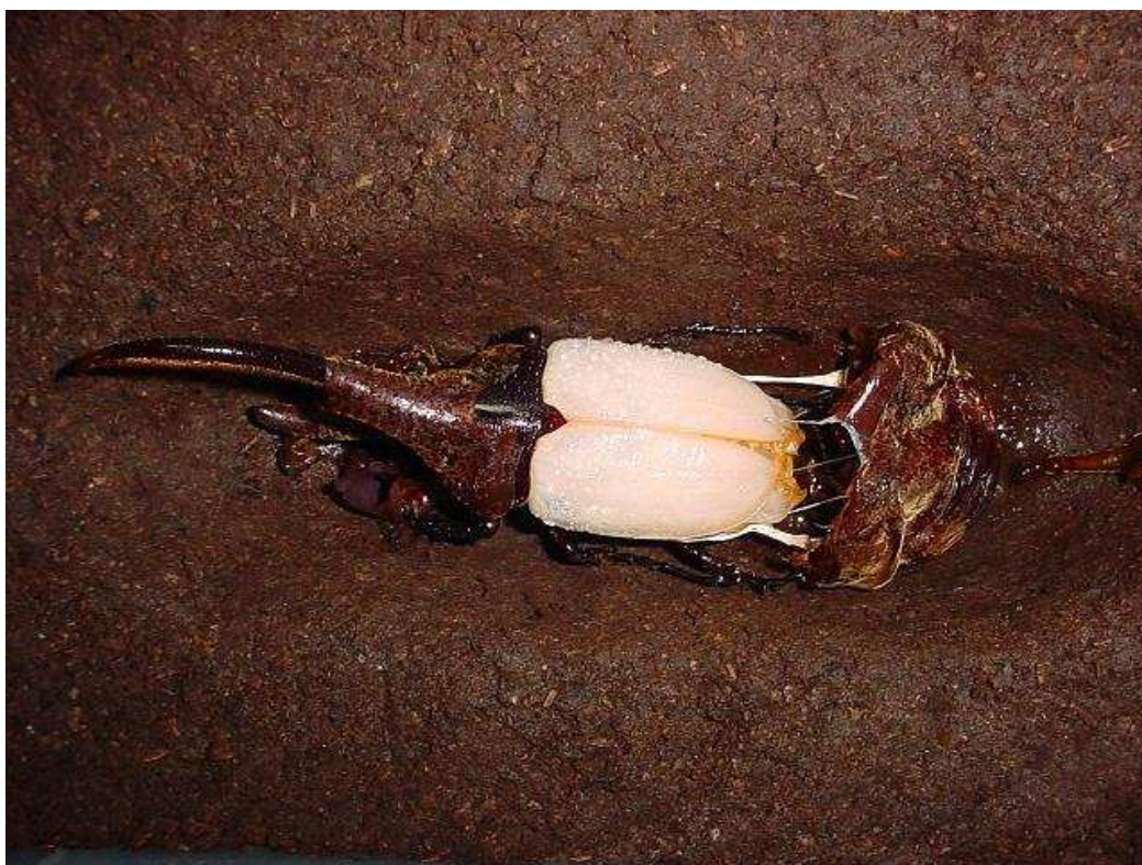
Foto 4: un maschio di Dynastes hercules hercules mentre fuoriesce dall'exuvia pupale, dopo 3 mesi e mezzo dall'impupamento.

Andate al più vicino garden center e procuratevelo. Siate certi di prenderne uno senza additivi chimici (totalmente organico). Ora è pronto all'uso. Potete anche utilizzare questo substrato per mantenere ed allevare alcuni cervi volanti (ad es. gli appartenenti al genere Odontolabis ). In ogni caso, è già stato testato per Prosopocoilus o altri Lucanidi. Comunque, sarebbe prudente NON usarlo in maniera generalizzata per mantenere ed allevare coleotteri Lucanidi.