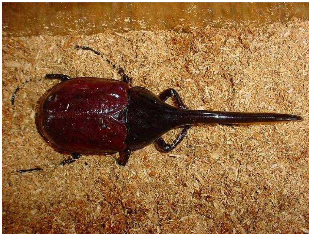
Foto 5: La pupa della foto iniziale ha dato alla luce, il 3 marzo 2005, a questo splendido maschio di 150 mm.

Riguardo invece alle note finali, queste ultime preoccupazioni dell'Autore nascono dal fatto che il Giappone regola severamente tanto il tipo di Insetti importabili quanto quelli allevabili. In Italia l'importazione, il mantenimento in cattività e l'allevamento di questa specie di Coleotteri risultano (al momento della stesura di questo documento, 5 settembre 2006) legali in tutto il Paese. Caso a parte è la Regione Marche, la normativa della quale prevede per questi come per gli altri Coleotteri d'affezione la denuncia presso il proprio comune di appartenenza. Per maggiori informazioni sulla legge in questione, http://www.regione.marche.it/bur/02/87.0108/leggi/3.html . Prego qualunque lettore che fosse a conoscenza di altre Leggi Regionali che proibiscano o regolamentino l'allevamento di questi animali di comunicarmelo, per poter aggiornare questo documento.