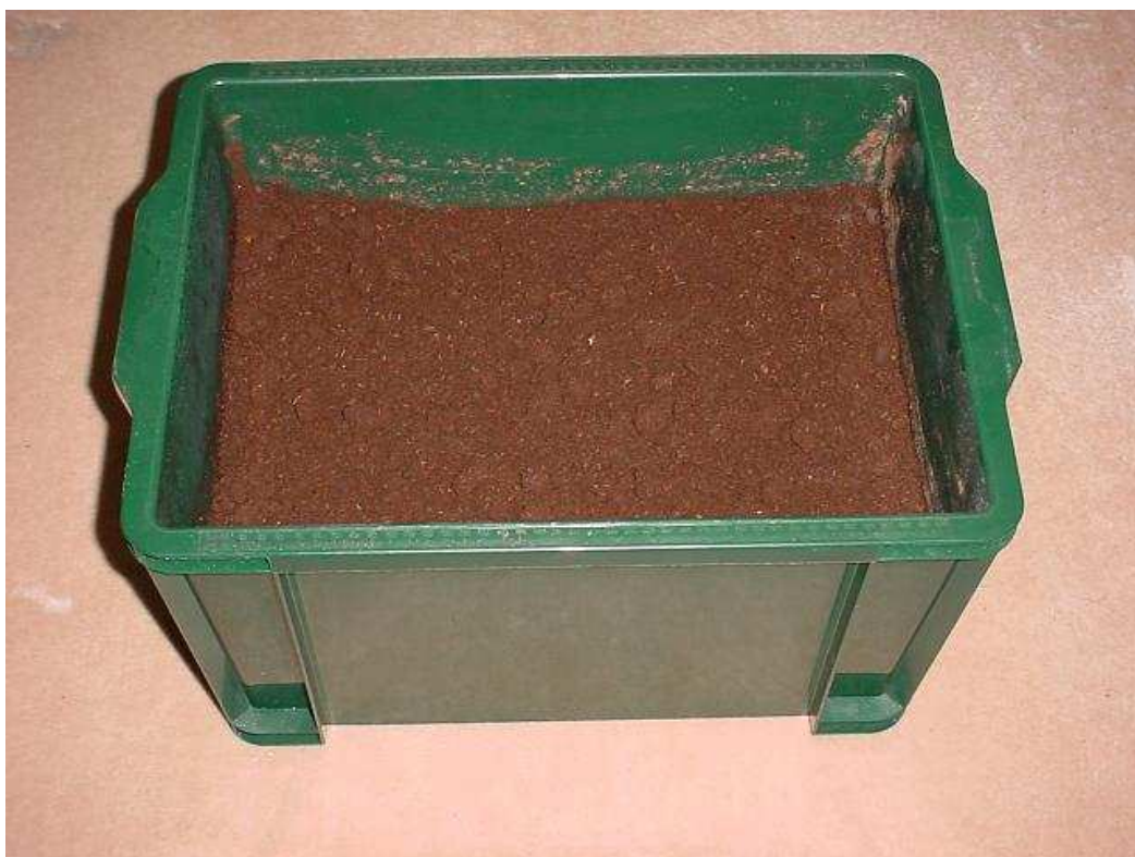
Foto 2: Il contenitore da 60 litri riempito di substrato in cui è stata allevata la larva della foto 1. Ottobre 2002.