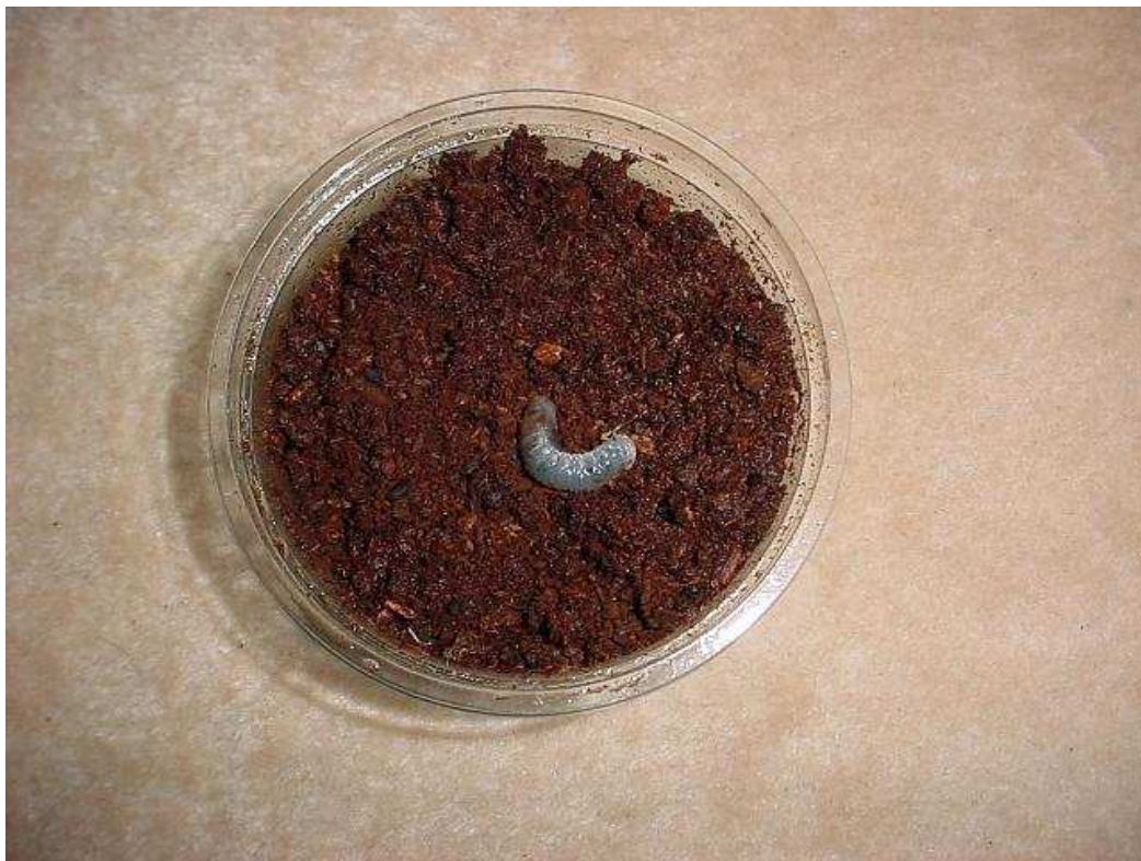
Foto 1: Larva maschile di D. hercules hercules , al primo stadio, un mese di vita. Ottobre 2002.